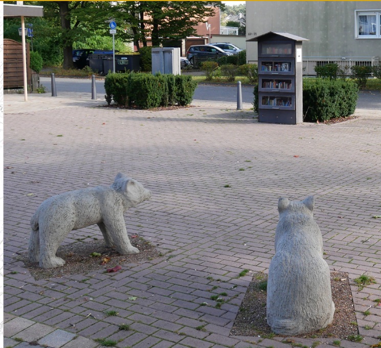
Beispielprojekt: Bücherschrank am Bärenplatz