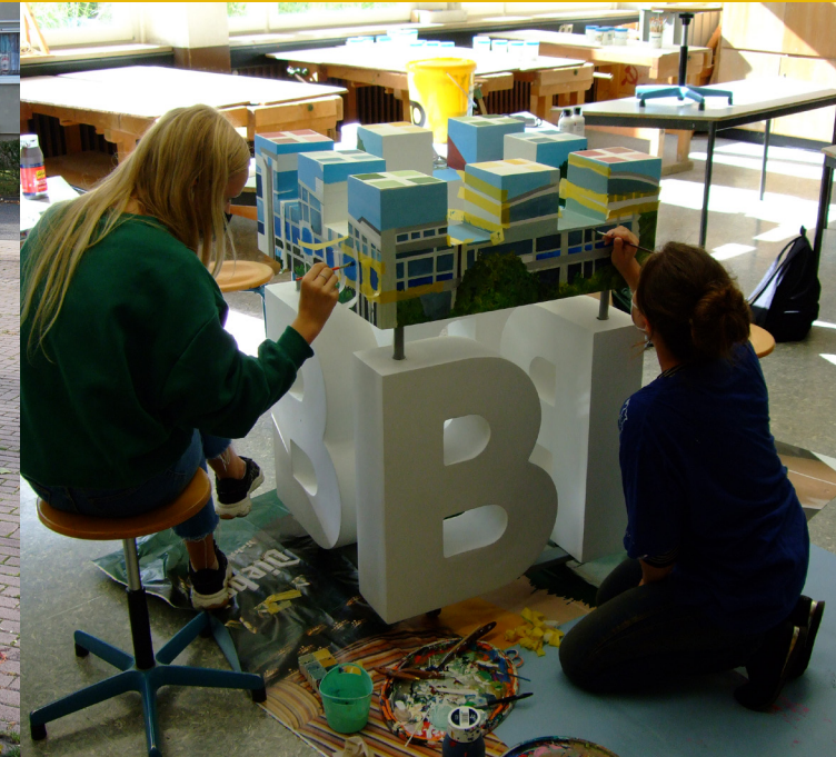
Beispielprojekt: Gestaltung des Bielefeld-Würfels